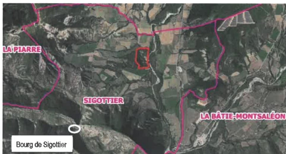
Figure 1: localisation du site de projet (en rouge).

Le site est constitué en grande partie d'un reboisement en Pin noir d'Autriche. Il est situé sur une terrasse qui domine de plusieurs mètres le Grand Buëch.